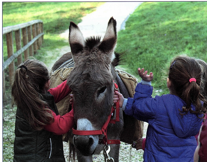
Bambini con un asino del centro infanzia

Ascoltando la direttrice, traspare l'entusiasmo con cui lei ed il team portano avanti questo progetto, non perdendo mai di vista la cura ed il benessere